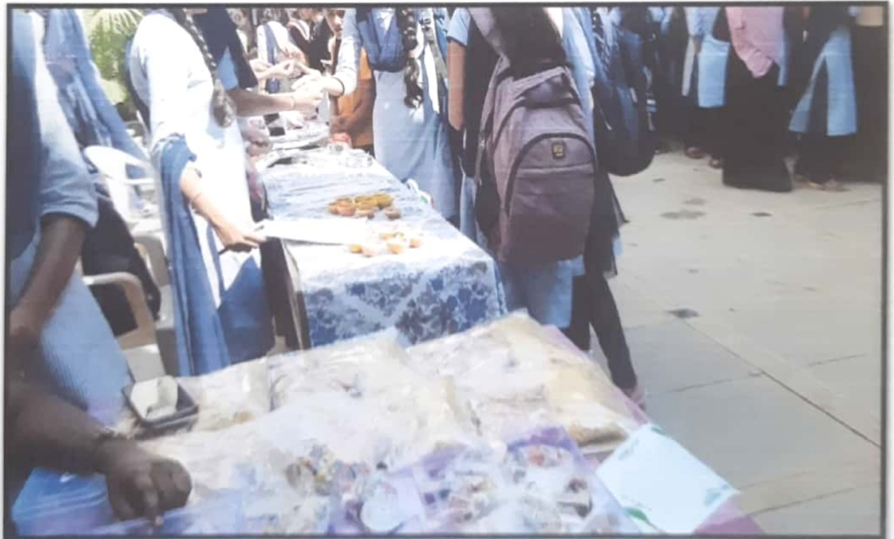
ट्रेड फेअर मध्ये विद्यार्थिनींनी लावलेले स्टॉल