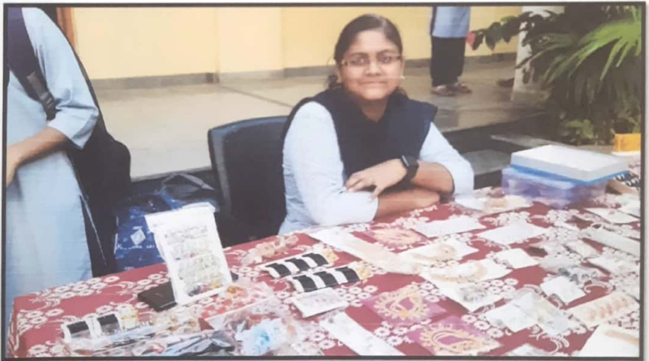
ट्रेड फेअर मध्ये विद्यार्थिनींनी लावलेले स्टॉल