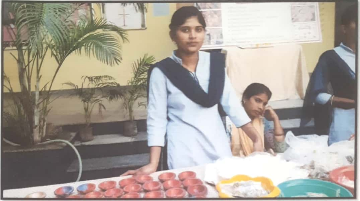
ट्रेड फेअर मध्ये विद्यार्थिनींनी लावलेले स्टॉल