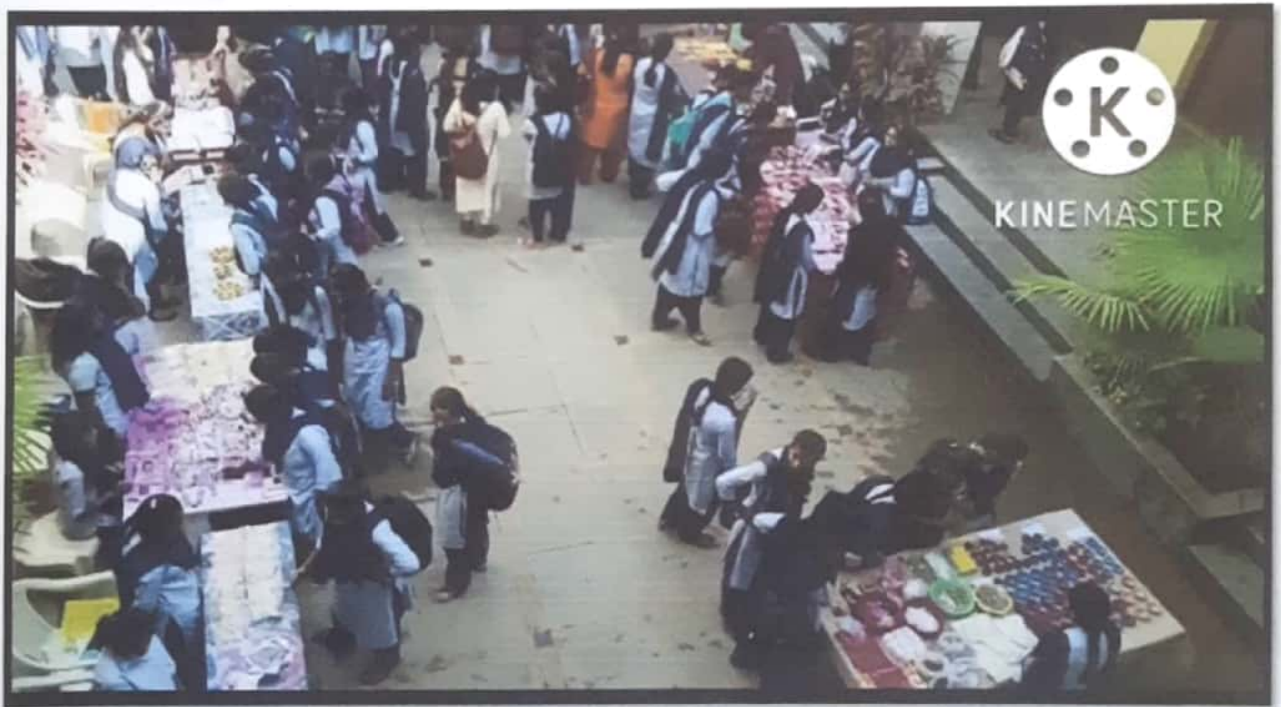
महाविद्यालयातील बहुसंख्य विद्यार्थिनींनी दिलेला उस्फूर्त प्रतिसाद