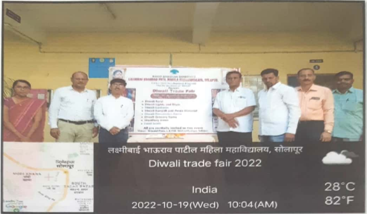
लक्ष्मीबाई भाऊराव पाटील महिला महाविद्यालय, सोलापूर Diwali trade fair 2022