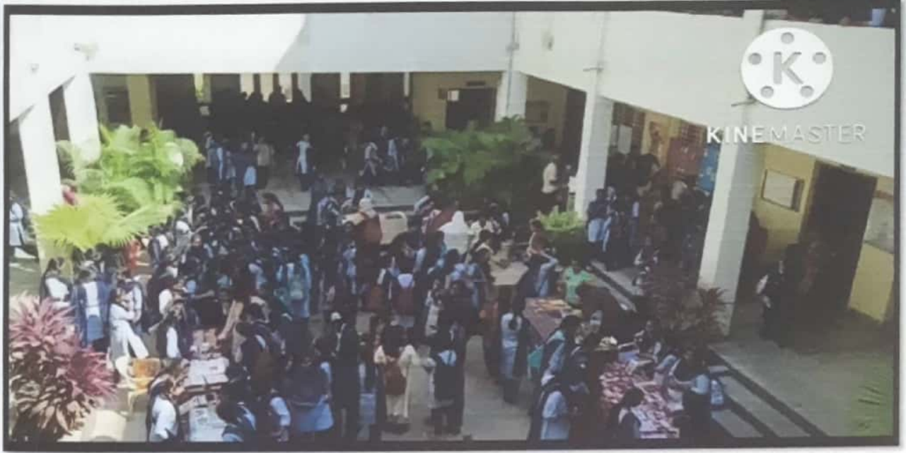
महाविद्यालयातील बहुसंख्य विद्यार्थिनींनी दिलेला उस्फूर्त प्रतिसाद