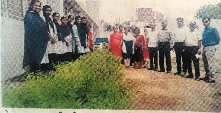
सोलापूर : लक्ष्मीबाई भाऊराव पाटील महिला महाविद्यालयात साकारण्यात आलेल्या ऑक्सिपार्कसोबत विद्यार्थिनी व शिक्षक.