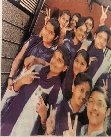
ल. भा. पाटील महाविद्यालयातील कोर्समध्ये सहभागी झालेल्या विद्यार्थिनी.